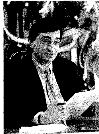
Il consigliere di Stato Marco Borradori.

Un'opera particolarmente utile anche sul fronte del contenimento del traffico frontaliere su strada. «Ogni giorno, nel Mendrisiotto e sull'autostrada A2 a sud di Lugano, si muovono circa 35mila frontaliere. La nuova linea – grazie anche all'orario cadenzato, alla realizzazione delle stazioni di Stabio e del Gaggiolo, e ai Park&Ride – offrirà una valida alternativa ai pendolari, elimi-